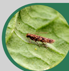
Makadlovka jihoamerická Tuta absoluta

Uvolňované feromony jsou druhově specifické pro makadlovku Tuta absoluta .