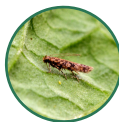
Makadlovka jihoamerická Tuta absoluta

Uvolňované feromony jsou druhově specifické pro makadlovku Tuta absoluta .